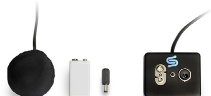
Capteur à intégrer dans la semelle des chaussures pour générer de l'énergie