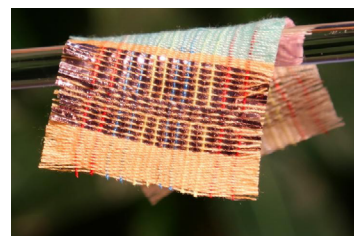
Fibre générant de l'électricité par effet de triboélectricité

D'autres entreprises, comme la compagnie néo-zélandaise StretchSense, utilisent l'effet piézoélectrique pour générer de l'énergie. Cet effet correspond à la propriété qu'ont certains matériaux de générer de l'énergie lorsqu'ils subissent une action contraignante. Cette entreprise a par exemple développé un coussin, intégré dans la semelle des baskets, qui génère de l'électricité lorsqu'il est comprimé, c'est-à-dire lorsque l'on marche.